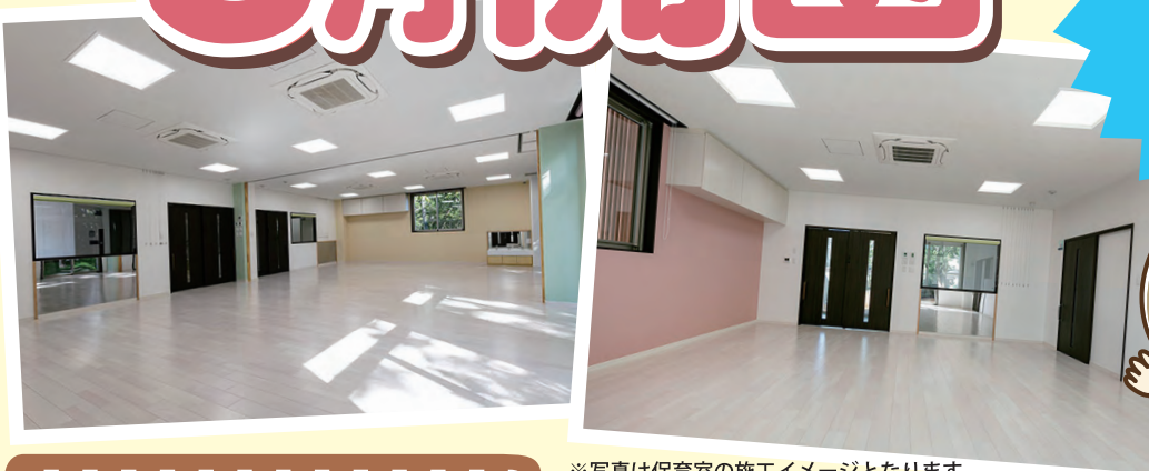
※写真は保育室の施工イメージとなります。